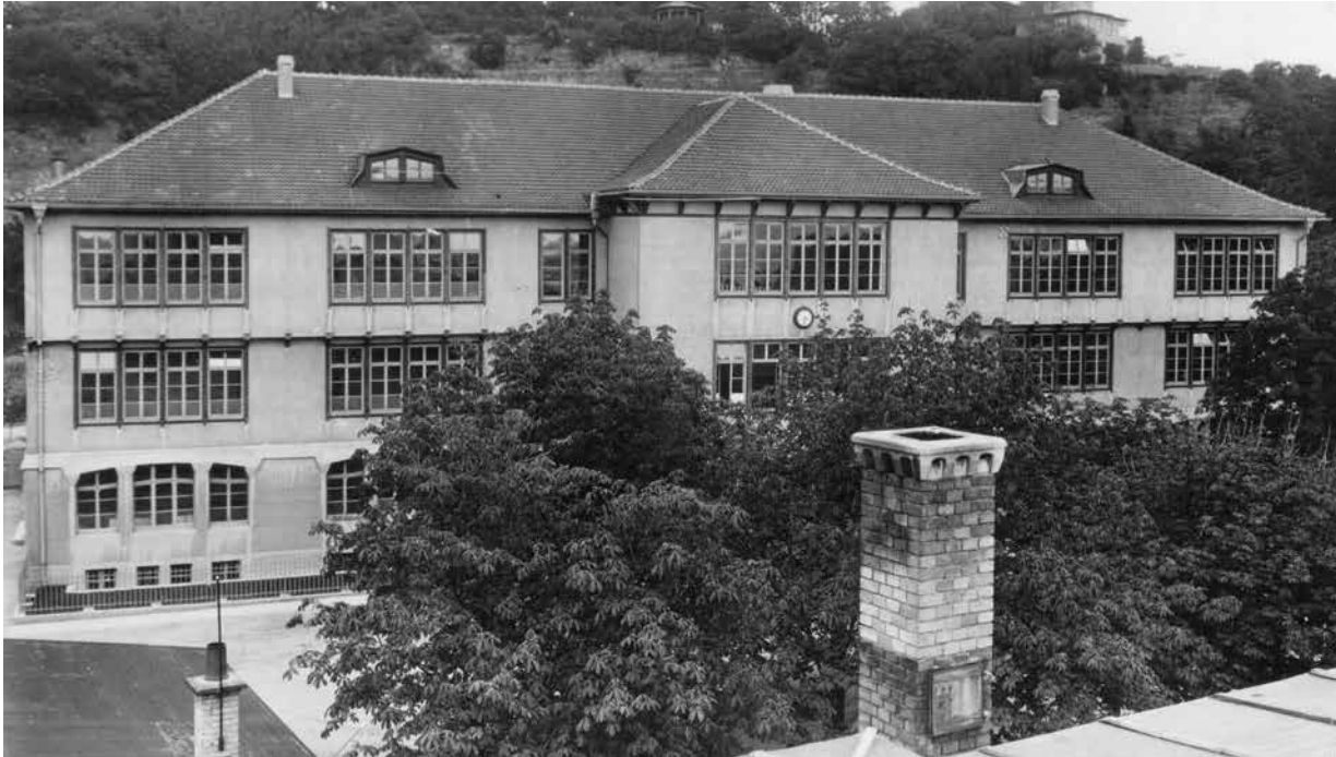
Hauptgebäude der von Steiner geleiteten und rasch gewachsenen ersten Freien Waldorfschule in Stuttgart, 1923.