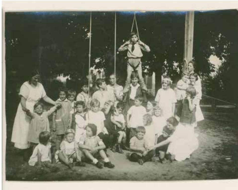
Kinder aus dem heilpädagogischen Heim «Sonnenhof» in Arlesheim, das als eine der ersten Stätten für anthroposophische Heilpädagogik von der Ärztin Ita Wegmann gegründet wurde, 1924.